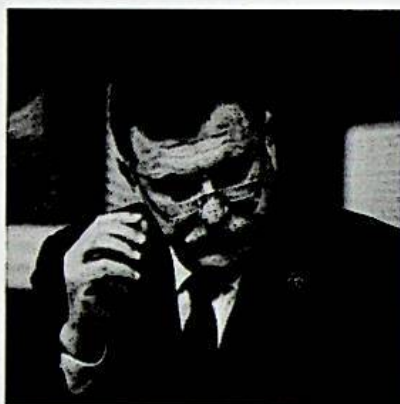
Fajez Sarraj

IL CONVOGLIO su cui questa mattina viaggiava il capo del Consiglio presidenziale libico Fajez Serraj sarebbe stato attaccato a colpi di mitra oggi mentre le auto passavano a Tripoli accanto all'Hotel Rixos. L'albergo è una delle sedi del gruppo di miliziani ribelli che fanno capo all'ex premier Khalifa Ghwell.