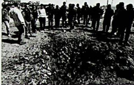
Curiosi attorno al cratere di una bomba esplosa a Est di Bengasi.

Grandi opere e pmi bloccate. L'Eni resiste. Ma la Camera italo-libica non si arrende: «Serve agire subito».