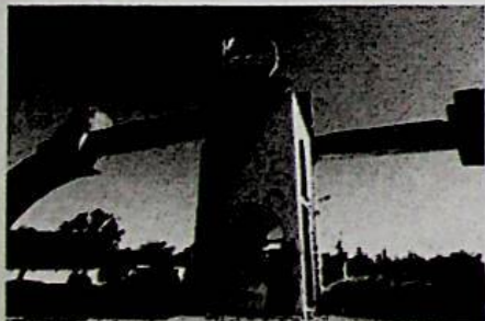
L'aeroporto di Tripoli dilaniato dai combattimenti.

Salini-Impegno ferma. Solo l'Eni regge: «Produzione standard»