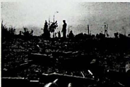
I resti della battaglia di Tripoli per l'aeroporto internazionale.

La Camera italo-libica alla Farnesina: «Bisogna agire subito»