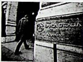
Ecco le banche sane che Banca d'Italia ha fermato