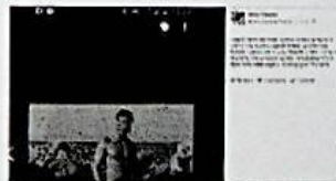
Cucchi: «Ecco chi ha ucciso Stefano»

Ilaria ha pubblicato su #Facebook la fotografia di uno dei carabinieri indagati. Scoppiata la polemica tra chi sostiene che incita alla violenza e chi la difende