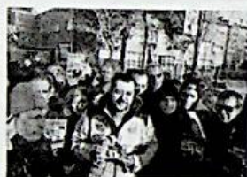
I leghisti del Sud chiamano Salvini: «Fai il...