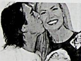
Fine di un amore Il 2015 nero dei vip