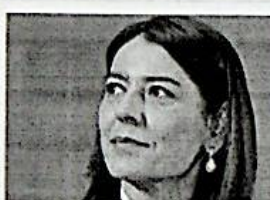
Roma si siede a tavola con Salvini