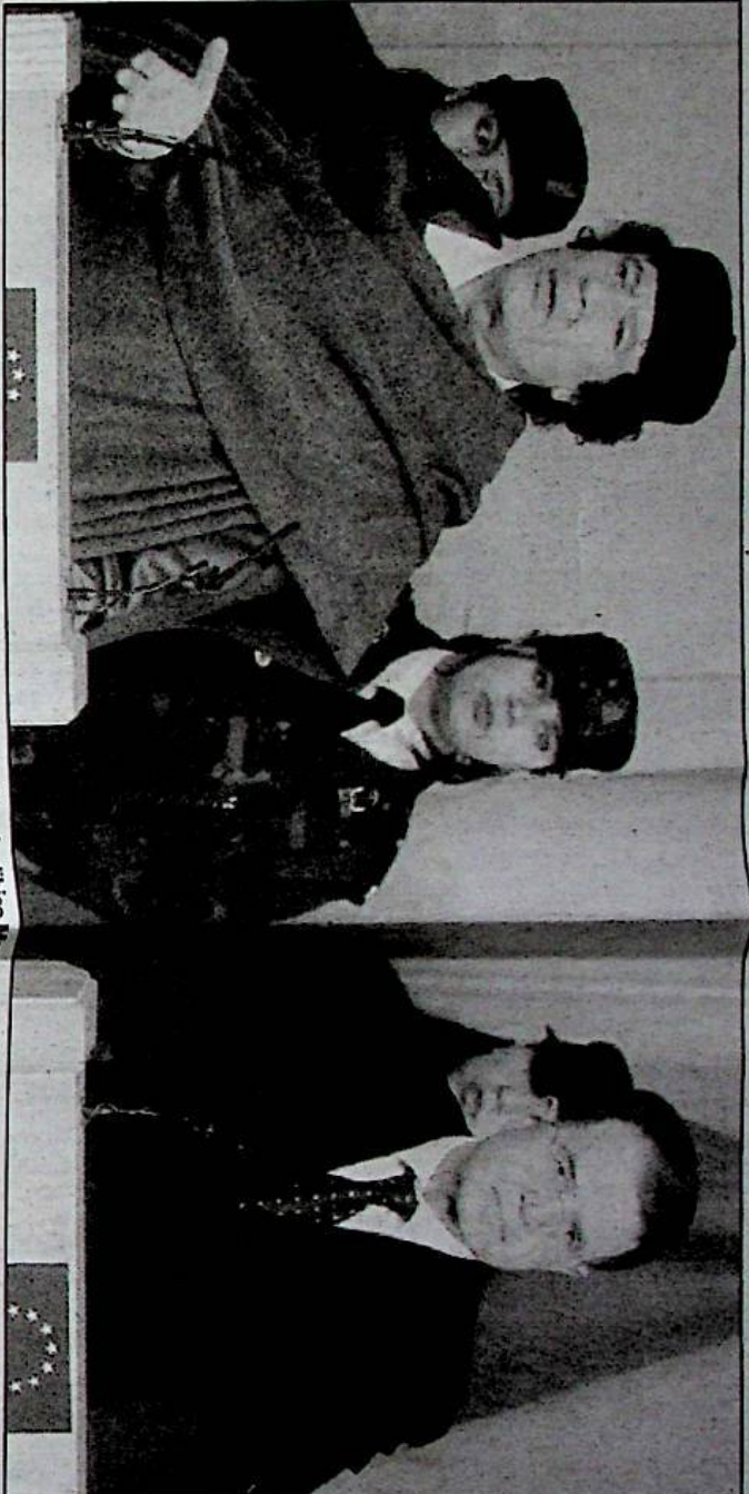
Bruxelles. Il presidente della Commissione europea, Romano Prodi, assieme al leader libico Muammar Gheddafi durante l'incontro di ieri

Vestito con la tradizionale «ghebbia» color marrone e scortato dalle sue guardie del corpo (le cosiddette «amazzen»), giovani donne in tenuta verde-oliva da combattimento, Gheddafi era stato accolto all'aeroporto dallo stesso Prodi. Insistentemente raggiunto Palazzo Broletto su un'auto bianca di grossa cilindrata. Nessun dubbio che i colloqui e la colazione di lavoro, cui hanno partecipato tutti gli euro-commissari, sono stati positivi. Mentre erano in corso, qualche centinaio di africani ha