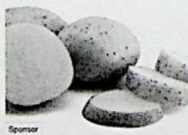
I 5 cibi più velenosi che tutti mangiano (topfive.it)