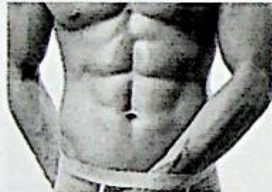
Cancro alla prostata: sintomi e prevenzione