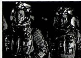
Impazza su internet la teoria dell'asteroide che...