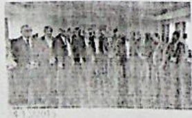
01/07/2015 Lobier: "Gli islamisti puntano al petrolio. In Libia bisogna agire il prima possibile"