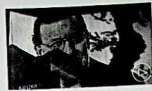
Spagna, Rajoy vince senza maggioranza

passaggi chiave, però, sono il 12 e il 15. Il paragrafo 12 sprona tutti i paesi ad «assistere rapidamente il governo nel rispondere alle minacce alla sicurezza libica, e appoggiarlo attivamente per sconfiggere l'Isis, Ansar al Sharia, e altri individui o gruppi associati con Al Qaeda».