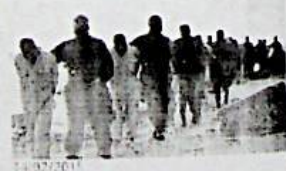
14/02/2015 L'Isis avanza in Libia, presso l'ospedale di Sirte. La radice jihadista: Gentiloni crociato, Italia nemica