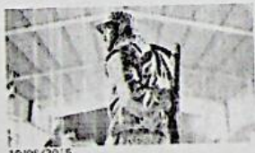
19/06/2015 "Né medicine né cibo, a Sirte è l'inferno. Fermate l'Isis o prenderà tutta la Libia"