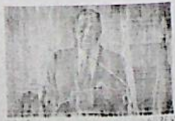
Levitov a Roma offre aiuto: "Ma niente truppe sul campo"