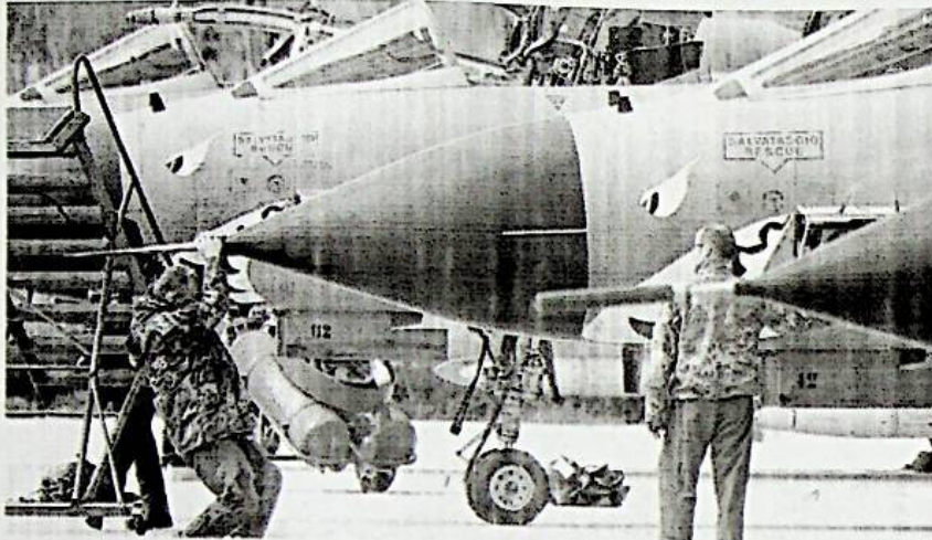
I cacciabombardieri italiani stanno scaldando i motori

L'ambasciatore libico al Palazzo di Vetro: nostre truppe contro l'Isis con appoggio aereo. I blitz potrebbero scattare subito. Gentiloni: passo importante, nostro ruolo decisivo