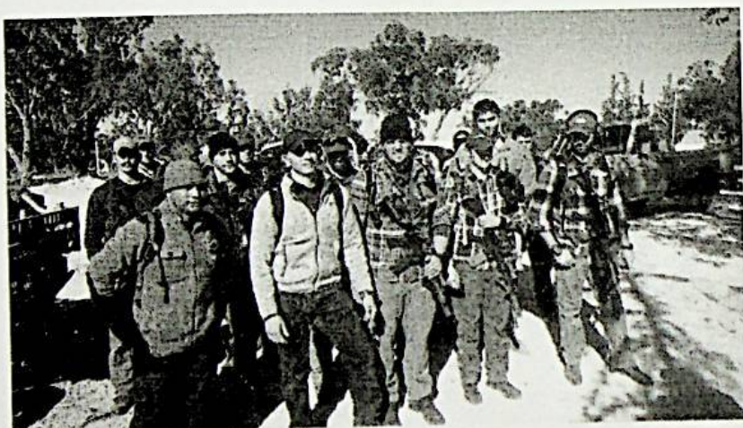
Militari americani fotografati nella base aerea della Libyan Air Force di Wattiya, 14 dicembre 2015. Libyan Air Force

La presenza militare americana in Libia dal 16 dicembre 2015 non è più un segreto e a rivelarlo è stato Facebook, o meglio la pagina Facebook della Libyan Air Force ( https://www.facebook.com/libyan.air.forces/posts/1071558019541128 ): con un post scritto in arabo l'aeronautica libica ha salutato l'arrivo di un commando militare americano composto da 20 uomini atterrato martedì 14 dicembre alla base aerea di Wattiya, una delle più grandi in Libia situata nella parte occidentale del Paese, notizia confermata anche dal Pentagono ai media statunitensi . ( http://www.nbcnews.com/news/world/u-s-special-operations-forces-ordered-leave-libya-after-apparent-n481841 )