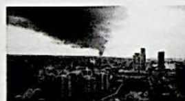
03/08/2014 Libia nel caos, battaglia a Tripoli