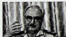
18/05/2014 Haftar, il generale deposto che vuole salvare la Libia