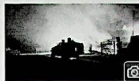
Notte di fuoco in Libia, il Paese nel caos