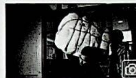
Libia: migliaia famiglie in fuga per terra e per mare