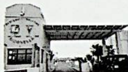
20/05/2014 Scontro Renzi-Ue sulla Libia Haftar sempre più forte