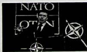
26/08/2014 La Nato blinda il confine est dell'Europa. Intervista a Rasmussen: "La Russia destabilizza l'Ucraina" MARCO ZATTERIN