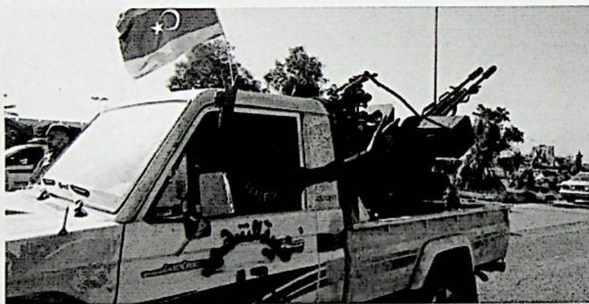
Miliziani islamisti festeggiano dopo aver conquistato l'aeroporto di Tripoli

Il quotidiano cita fonti ufficiali degli Usa e svela a chi appartenerebbero i misteriosi caccia che in questi giorni hanno colpito le milizie che assediano Tripoli. Nella capitale libica nel caos si riunisce il vecchio Parlamento in seduta "clandestina" (con 70 dei 200 ex deputati) ed elegge premier un docente universitario vicino agli islamisti