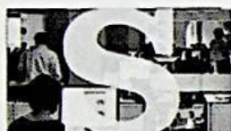
27/06/2014 La Libia brucia per la spartizione del greggio. E anche l'Italia rischia di usti...