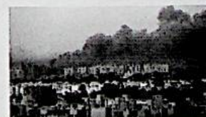
23/08/2014 Libia, raid aerei e morti a Tripoli. Gli islamisti annunciano: "Preso l'aeroporto"