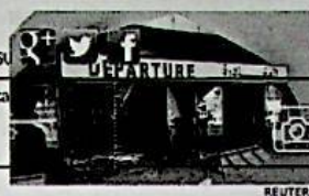
L'aeroporto di Tripoli dopo la battaglia

Il summit dei Paesi confinanti con la Libia nel frattempo invita le parti in conflitto ad avviare un dialogo nazionale che porti alla fine di tutte le operazioni militari, al caos e alla violenza nel Paese. Al summit hanno partecipato Egitto, Ciad, Mali, Tunisia e Algeria, oltre al ministro degli Esteri libico.