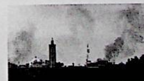
21/08/2014 Libia, chiuse le scuole come nel 2011