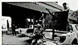
20/05/2014 Libia, le forze speciali passano con i golpisti. Tripoli: c'è dietro l'Egitto