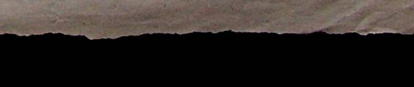
Lampedusa (Afp/Ansa) sbarco di clandestini (Afp/Ansa)