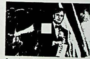
Scandalo a Miss America, la telecamera sotto la gonna di Miss Nebraska