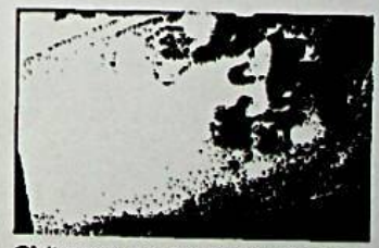
Civitanova, con lo scooter sfondano il bar: il video dell'assalto