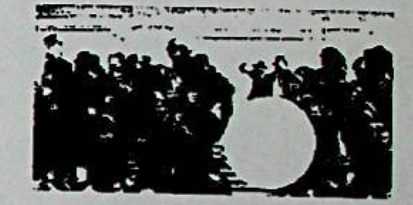
Roma, sorpresa a piazza di Spagna: ballerino della Tim scatena le danze scalinata

Convertitore di valute in linea con l'euro, il dollaro e le monete mondiali. Il cambio viene effettuato in base alle chiusure delle v della Banca Centrale Europea e dell'Ufficio Italiano di Servizio a cura di Telesorsa