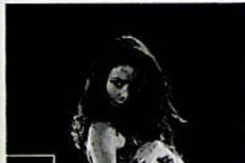
GALLERY - Gli incidenti «sensuali» delle star sul... (Vanity Fair)