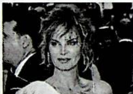
Dalila Di Lazzaro rivela: «Incinta a 62 anni ho...