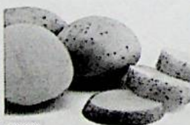
I 5 cibi più velenosi che tutti mangiano (topfive.it)