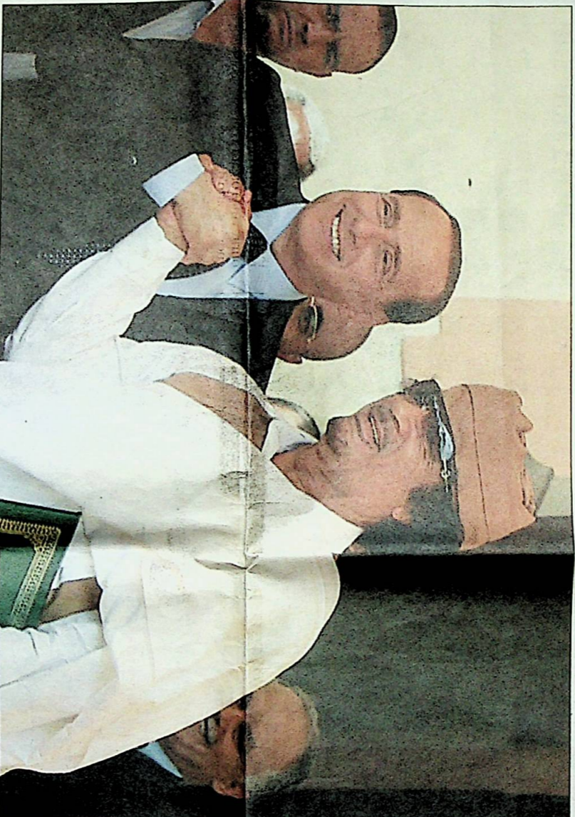
Silvio Berlusconi stringe la mano al leader libico Muammar Gheddafi durante il loro incontro a Bengasi il 30 agosto 2008.

Il fatto che nell'articolo 4 non c'è alcun riferimento diretto agli accordi internazionali da rispettare (da parte italiana). Una omissione, riflettono le fonti Nato, che segna, oggettivamente, un punto a favore del leader libico. Sul tema interviene anche Massimo D'Alema. «Credo che innanzitutto si debba dire che la Nato è un'alleanza difensiva e non ha nei suoi programmi di aggredire nessun Paese», afferma l'ex titolare della Farnesina. D'Alema, tra l'altro, ha tenuto a sottolineare: «Quest' accordo con la Libia era stato negoziato da noi, me ne ero occupato personalmente e a lungo». Un accordo la cui traccia «è quella che avevano predisposto: non prevede Clausole segrete. Credo, almeno per quanto ne so io», ha aggiunto. Ma una traccia può essere «forzata». Così è stato.