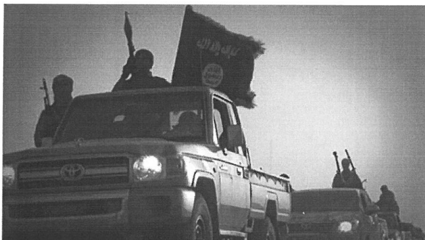
Miliziani dell'Isis in Libia

La "collaborazione bilaterale nella sicurezza" porta ad "operazioni congiunte" tra libici ed egiziani