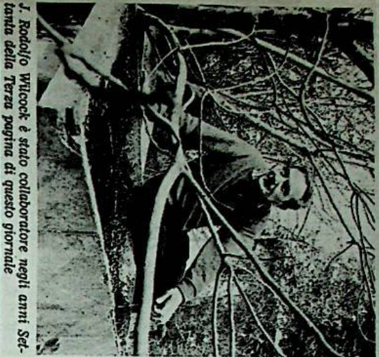
Rodolfo Wilcock è stato collaboratore negli anni Settanta della Terza pagina di questo giornale

Tornano le opere di Wilcock Quell'esoterico anticommunista