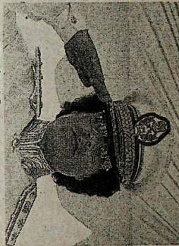
Il leader libico Gheddafi

WASHINGTON — Gli Stati Uniti hanno protestato contro l'installazione di una fabbrica di prodotti chimici a Ghedafli, in Libia, che produceva armi chimiche. Il presidente Reagan ha sgridato Bonn e Tokyo per l'aiuto che stanno dando alla Libia. Il presidente ha detto che la Libia è un paese che non rispetta i diritti umani e che è un pericolo per il mondo. Reagan ha detto che gli Stati Uniti non hanno altra scelta che far fuori il colonnello Gheddafi.