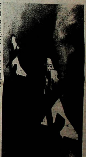
Due Mig 23 libici del tipo di quelli abbattuti il largo di Tobruk