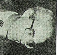
Il ministro dell'Interno Giulio Andreotti

«Non mi sento stobbo». L'incontro con Gheddafi non era previsto. Non era una visita bilaterale.