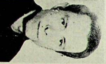
Il servizio in Cronaca