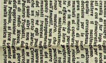
Il servizio in Cronaca