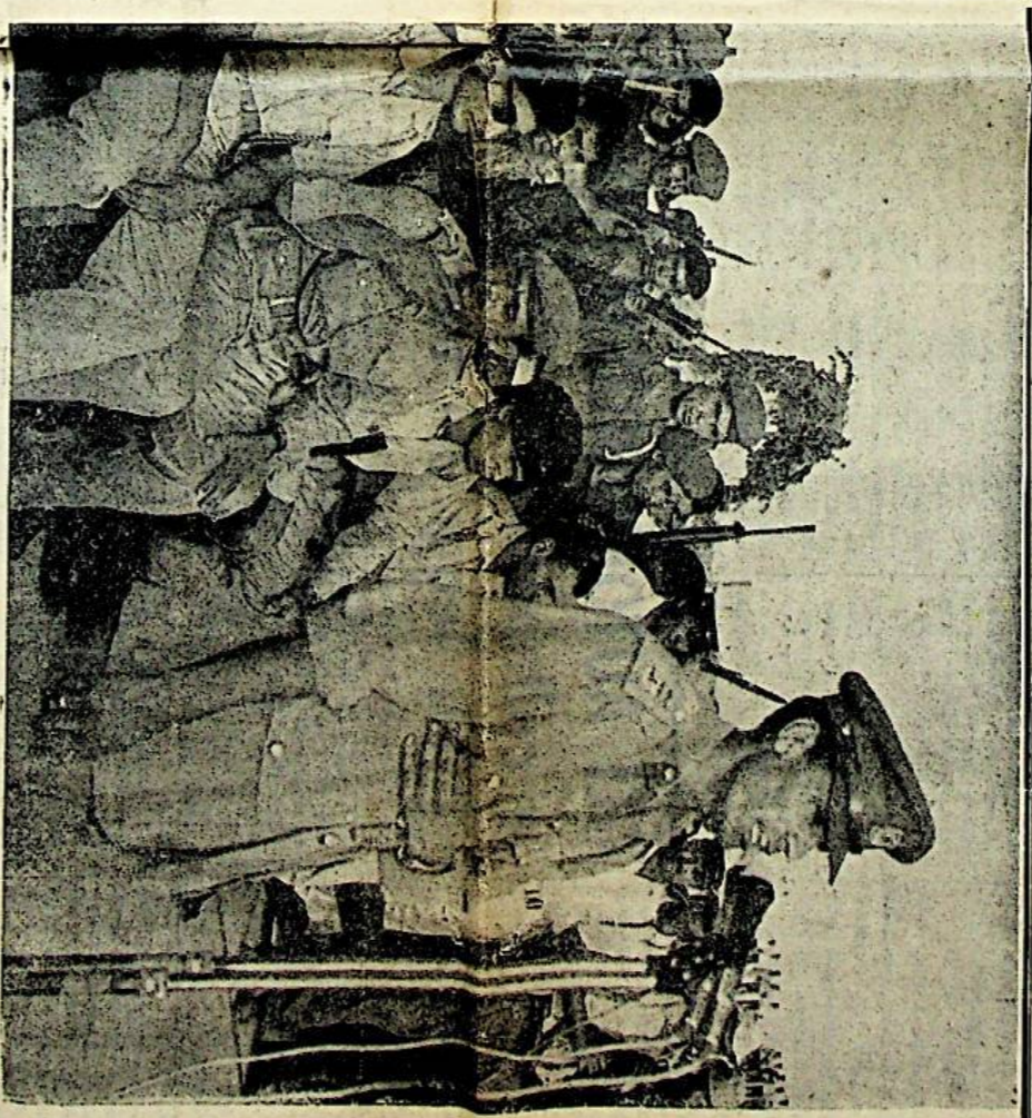
Il Presidente del CCR Col. Gheddafi mentre pronuncia il discorso di commemorazione del Martire Omar El Mukhtar

«La vostra vittoria - è detto nel telegramma - ha liberato il popolo libico per aiutarlo a prendere il suo posto nel movimento di solidarietà afro-asiatica, i cui obiettivi sono i vostri stessi».