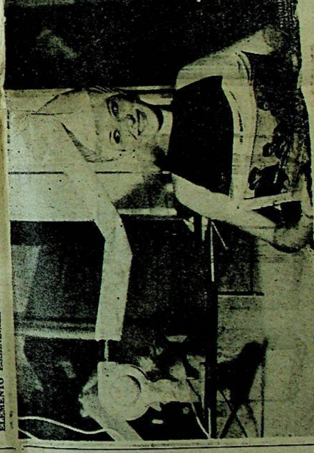
E' un aiuto di collina, predestinato e bocchettono per l'automobilista.

L'ASCIGUAPPELLI DI FORMA TRADIZIONALE E PRATICA. LEGGERO - ECONOMICO. E' UN ELEMENTO ESSENZIALE CHE COMPLETA IL VOSTRO CONFORT