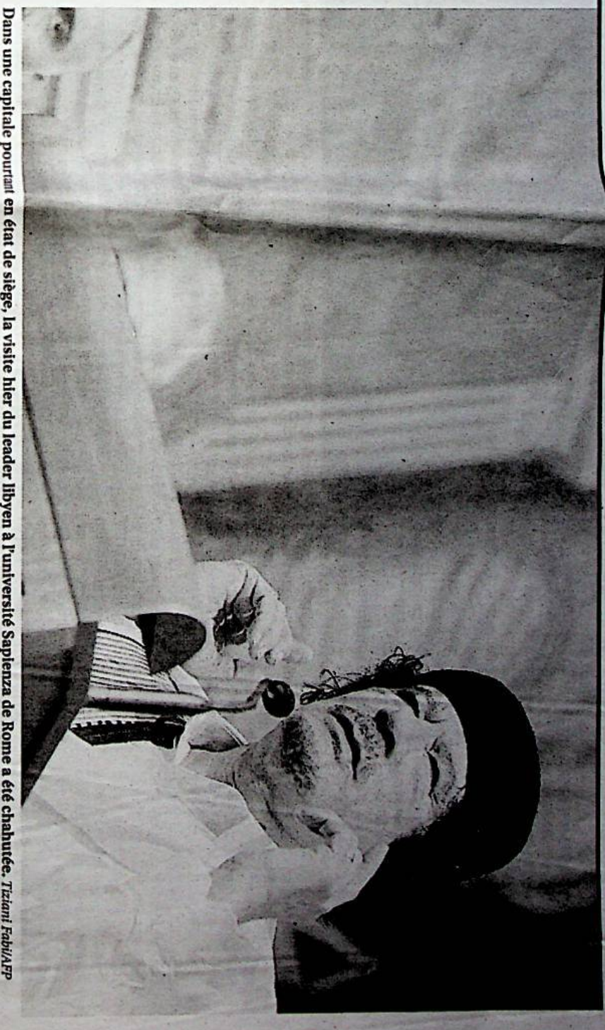
Dans une capitale pourtant en état de siège, la visite hier du leader libyen à l'université Sapienza de Rome a été chahutée.

La Libye présidera à partir de septembre l'Assemblée générale des Nations unies. « L'Afrique a droit à un siège permanent avec droit de vote au Conseil de sécurité comme la Chine », affirme le président de l'Union africaine. Quant au Conseil de sécurité, qu'il se tieme à carreau : durant son mandat, il se fait fort de lui imposer « les décisions prises par l'Assemblée générale ».