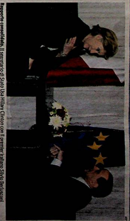
Rapporto consolidato. Il segretario di Stato Usa Hillary Clinton con il premier italiano Silvio Berlusconi

Il braccio destro di Saddam Hussein, Tarek Aziz, classe 1936, è stato ministro degli Esteri e vicepremier durante la dittatura di Saddam Hussein. Unico cristiano cattolico (caldeo) dell'entourage di Saddam, giornalista laureato in letteratura inglese, era considerato il volto presentabile del regime.