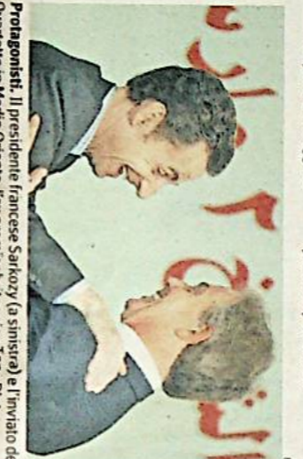
Protagonisti: il presidente francese Sarkozy (a sinistra) e l'invitato del Quartiere in Medio Oriente, l'ex premier britannico Tony Blair

In dollari, la richiesta di aiuti da parte dei palestinesi