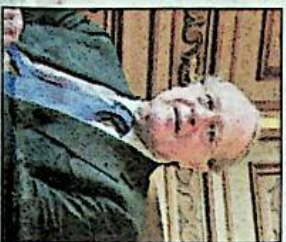
Un fatto è certo: il Libyan Energy Fund non metterà le mani sulla gestione della società. Ed è consapevole, fanno sapere da Palazzo Chigi, «dei limiti all'esercizio di voto stabiliti dalla legge italiana e dallo Statuto dell'Eni». Con il limite al 3% del diritto di voto indirettamente della quota di capitale acquisita.

Roma. Dopo Unicredit, l'Eni. Continua lo «shopping» della Libia fra i grandi gruppi italiani. Questa volta, nel mirino, c'è il colosso energetico guidato da Paolo Scaroni. Ma non si tratta affatto di una mossa ostile. E non solo perché l'ingresso è stato annunciato ieri da una nota ufficiale di Palazzo Chigi. Ma anche perché i rapporti fra l'Eni e Tripoli non hanno mai subito inclinature e si sono recentemente addirittura intensificati con il rinnovo per altri 25 anni dei contratti di esplorazione e produzione di petrolio e gas che deteneva nel Paese.