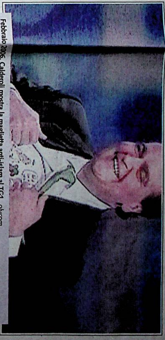
Febbraio 2006, Calderoli mostra la maglietta anti-Islam al TG1

UTILI IGNOTI Strumentalizzando i manifestanti uccisi, il Colonnello riuscì a strappare al nostro governo l'impegno a costruire un'autostrada litoranea dall'Egitto all'Algeria