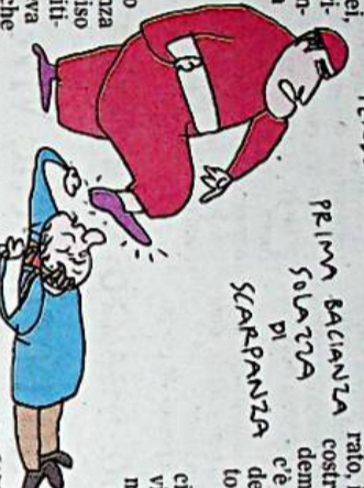
PER IL SALVATTA SCARFANZA? C'è un incontro tra il Cav. e il Cei...