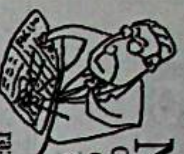
CORRESP. PER GIL OSV771

La carne e le ossa di Coscioni e Pardolessimo riscaldato (e fallimentare) di Berlusconi