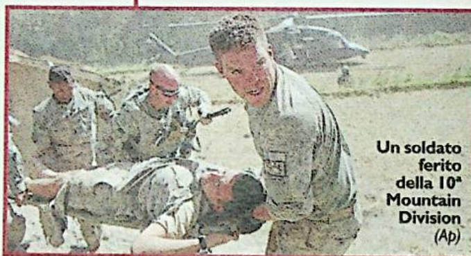
Un soldato ferito della 10 a Mountain Division