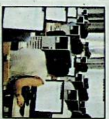
candidati restano impressionanti. Il Chiesa, il consorzio che stampa i quiz per il ministero, quest'anno ha dovuto produrre 150mila compiti.

ROMA - È relativamente stabile la situazione sul mercato del lavoro italiano. Nel mese di luglio l'Istat ha rilevato un tasso di disoccupazione all'8,4 per cento, identico a quello del mese precedente ed in crescita di mezzo punto percentuale rispetto a luglio 2009. Fermo anche il numero degli occupati. Mentre crescono in maniera abbastanza significativa gli inattivi, ossia coloro che per vari motivi hanno rinunciato a cercare un'occupazione. Resta alto, al 26,8 per cento (sebbene in calo rispetto ai mesi precedenti), il tasso di disoccupazione tra i giovani di età compresa fra i 15 e i 25 anni: di fatto un giovane su quattro è senza lavoro.