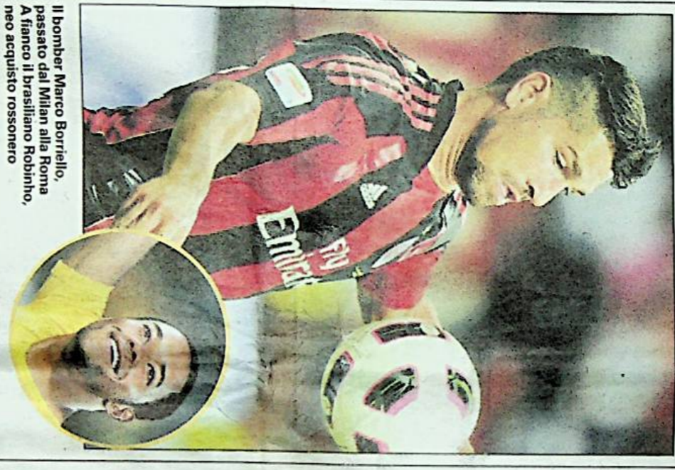
Il bomber Marco Borriello, passato dal Milan alla Roma. A fianco il brasiliano Robinho, neo acquisto rossoneri