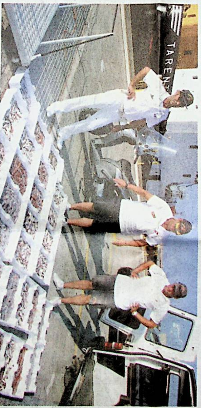
A PAGINA 35

BLITZ DELLA GUARDIA COSTIERA DI GAETA: PRODOTTO ILLEGALE SCADUTO