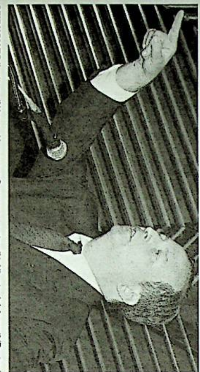
SFIDUCIATO Il rettore di Harvard Lawrence Summers: contro di lui il voto dei docenti (Fleuler)

«Rischio tumore per l'elettromagnetismo» Abitare vicino a cavi di alta tensione può aumentare le probabilità di sviluppare tumori al testicolo, soprattutto nei più giovani. Vivere a 100 metri da una linea di alta tensione farebbe crescere del 50% la probabilità di ammalarsi. Lo studio, tedesco, è pubblicato sulla rivista International Archives of Occupational and Environmental Health .