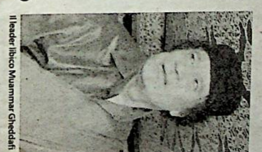
Il leader libico Muammar Gheddafi

Triplia è un paese qualunque, con una sua storia, una sua cultura. Ma chi parla la nostra lingua ne è orgoglioso. E' un espediente ideato da Gheddafi. Il contenzioso politico con Roma fa comodo ma chi parla la nostra lingua ne è orgoglioso.