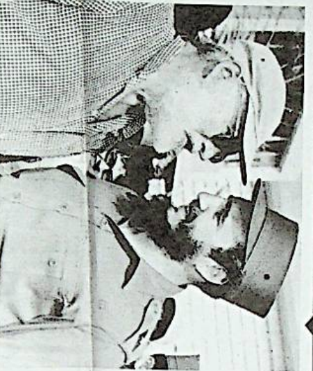
AMICI Ernest Hemingway con Fidel Castro a Cuba